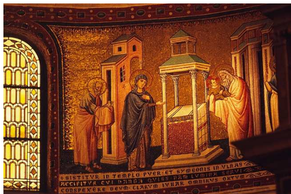
Santa Maria in Trastevere –