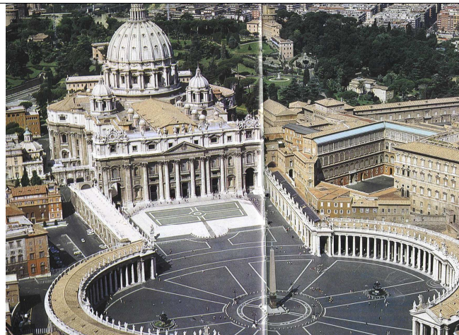
Szent Péter bazilika

30.-án, vasárnap az óriás kupolájú San Andrea Della Valle bazilikától a virágpiacon, a Farnese téren keresztül, a Pápai magyar intézet, a Palazzo Falconieri mellett elhaladva a Szent Péter térre mentünk.