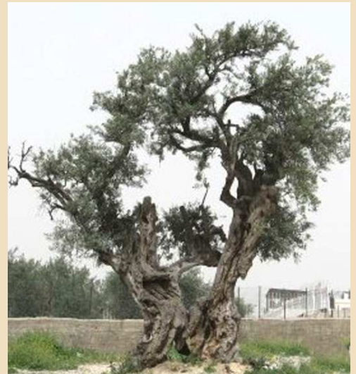
A mindig újraéledő olajfa

Legyetek hát tökéletesek, amint mennyei Atyátok tökéletes!