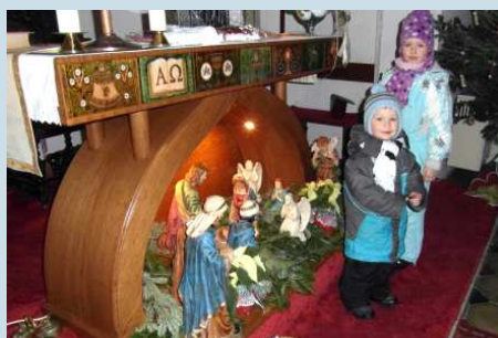
A templomi betlehem látogatói