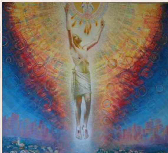
M.Ljubičić: Feltámadás / Vrh, Krk-sziget

Szeretettel kívánok hitben erős, örömteli húsvétot Leányfalu minden polgárának, keresztény testvéreinknek!