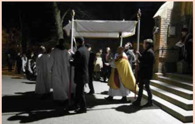
Nagyszombat, Feltámadási körmenet

Májusban volt az elsőáldozás. Tavaly tizenegyen voltak elsőáldozók. Az idén hat gyermek vette magához első ízben a Krisztus szent testét hordozó ostyát.