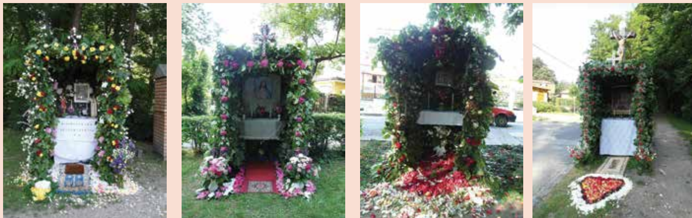
Úrnapja, az oltáriszentség ünnepe - a sátrak

Úrnapján a szokásnak, hagyománynak megfelelően készültek a világ négy égtáját jelképező sátrak, kis oltárok. A sátrak 'gazdái' sok generáció óta építik, díszítik a sátrakat, kicsiny kápolnákat, és adják mindig tovább a fiatalabbaknak ezt a közösség életét fenntartó szokást. Külön építik a sátrak szerkezetét, majd borítják a korábban gyűjtött zöld lombokkal, ez férfiak dolga. Asszonyok csoportjai készítik a sátrak oltárait, minden évben valami kis változást beépítve.