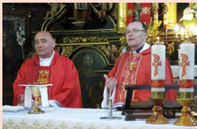
A szlovák-lengyel határon fekvő Orawka falu magyar temploma