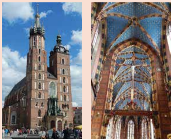
A Mária templom és belseje

megdöbbsentünk a Zebrzydowska Mária kegyképe előtt térdeplő sok fiatalon, akik több mint tíz perces ottlétünket követően sem mozdultak. Mint megtudtuk, az érettségizők 'szokása' Mária segítségét kérni.