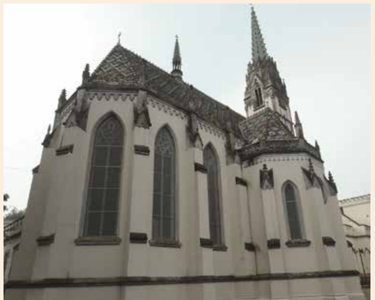
A tompai 'kis Mátyás templom'

A könyvtárban részletes és szakszerű vezetést kaptunk, így nemcsak látványként marad emlékezetünkben, de sok ismerettel is gazdagodtunk.