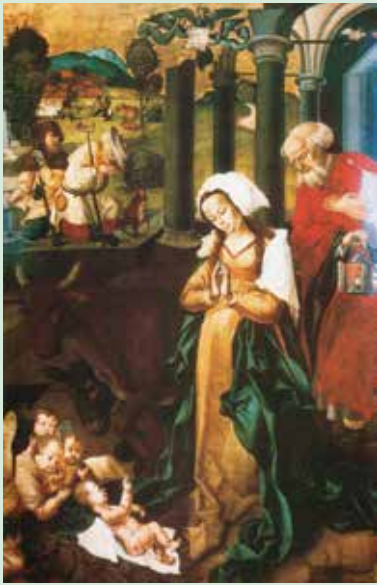
M.S. mester: Jézus születése

Pásztorok tanyáztak a vidéken, kint a szabad ég alatt, és éjnek idején őrizték nyájukat. Egyszerre csak ott állt előttük az Úr angyala, és beragyogta őket az Úr dicsősége. Nagyon megijedtek.