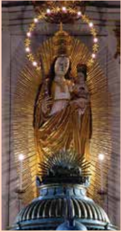
A csíksomlyói kegyesbaba

Tavaszi zarándoklatunkat Székelyföldre tervezzük. Május 1-5 között utaznánk Marosvásárhelyre, ahol a szállásunkat tervezzük. A feltételes fogalmazás indoka, hogy nehéz megfelelő szállást találni ilyen nagy létszámú csoportnak a megfelelő helyen, ahonnan elérhető közelségben vannak a meglátogatni kívánt helyszínek.