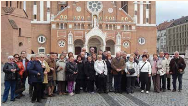
A zarándokcsapat a szegedi dóm előtt

Az első nap kevésbé szerencsésen alakult az eső miatt. Kecskeméten mégis megnéztük a belváros szép épületeit, köztéri szobrait. Ó-Pusztaszeren az erős eső elvette a lehetőséget, hogy a parkban körbejárhassunk, de a Feszty-körkép élményét nem tudta elvenni az eső. Sokan közülünk látták már az alkotást, de mindenki örült a látványnak.